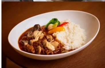
Hashed Beef 3,960

かつおぶしベースのお出汁におもちや椎茸、エビフライなどたっぷりの具材をいれ 焚き上げたなべ焼きうどん。お好みで焼おにぎりもつけてお召し上がりください。