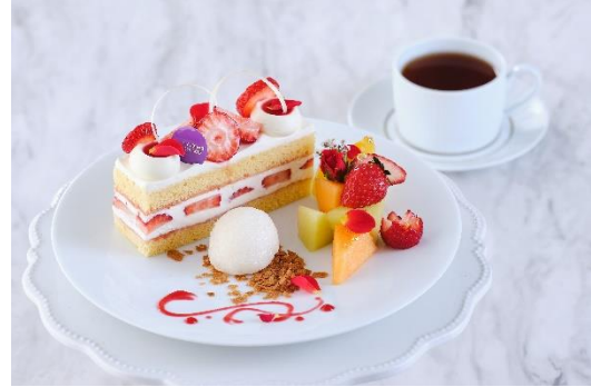
Goorgeous Cake Set ケーキセット + 550 ゴージャスケーキセット

色鮮やかなフルーツをふんだんに使用した宝石箱のような、プレミアムケーキです。ボリュームあるスポンジ生地と濃厚で滑らかなムースリースを合わせた、とっておきのフレジエ。