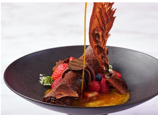
Chocolate Truffle Crepe Suzette ショコラトリュフクレープシュゼット 2,750

* Champagne Set シャンパンセット 4,950 * Drink Set ドリンクセット 3,630