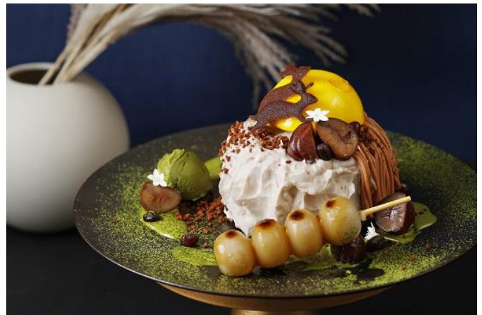
Moon Viewing Mont Blanc Pancake お月見モンブランパンケーキ 3,850

シャインマスカットと巨峰、2種のぶどうを贅沢に使用した秋パフェが登場。トップには華やかなデザインのプティガトーを可憐にあしらひ、グラスの中には、宝石のように美しく艶めくぶどうの果実、巨峰シャーベット、マスカットパナコッタ、ほのかに生姜が香るジンジャーゼリーなどを重ねました。一口ごとに広がる奥深い味わいと優美な佇まいを存分にお楽しみください。