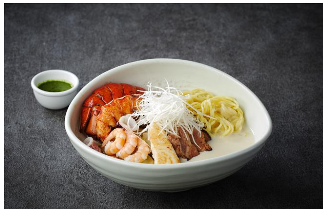
Seared Pork and Seafood Champon Noodle and Lobster with Basil Sauce 5,500