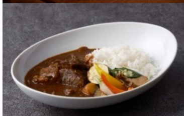
Fond-De-Veau Ox Cheek Curry 3,300

赤ワインとマデラワインでじっくりと煮込んだとろける牛肉、 滑らかな口当たりのハッシュドビーフライスです。