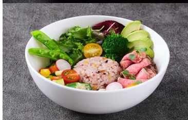
16 Multi Grain Rice with Roast Beef Salad 3,850

本場インドでポピュラーな赤いんげん豆のムングダール（皮を除去し、挽き割りにしたもの）を 使用したカレーです。ほのかなスパイスの香りとともにお召し上がりください。