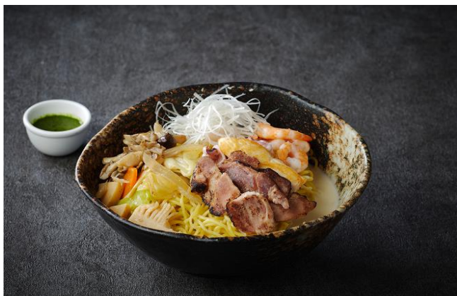
Seared Pork and Seafood Champon Noodle with Basil Sauce 3,300