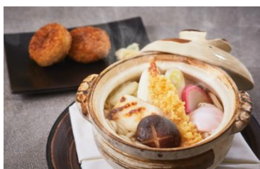
Udon Noodle Soup In a Japanese earthenware pot 3,080

鯛から出汁をとりコクのある豚骨ソースと合わせました。 香ばしい野菜炒めと豚ばらのチャーシューと共にお召し上がりください。