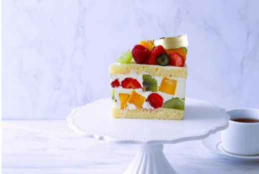
Premium Fruit Jewl Cake Set 3,685 プレミアムフルーツジュエルケーキセット

コーヒー | 紅茶 | アイスコーヒー | アイスティー (その他のコーヒー、紅茶のオーダーは + 330 となります)