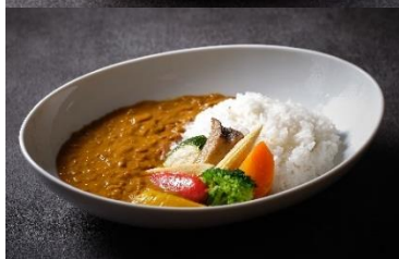
Red Kidney Beans Moong dal Veagan Curry 3,190

フレンチの技法でじっくりと仔牛の出汁をとり、 牛ほほ肉がやわらかくなるまで手間と時間を掛けて作った本格派カレーです。