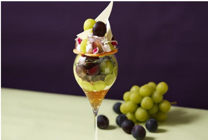
Shine Muscat & Kyoho Grapes Parfait シャインマスカット & 巨峰パフェ 4,400

* Champagne Set シャンパンセット 6,600 * Drink Set ドリンクセット 5,280