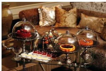
Seasonal Dessert Wagon 季節のデザートワゴン 3,740

季節のムースケーキや、チーズケーキ、チョコレート、プティガトーをワゴンでテーブルまでお持ちし、お好きなものを選んでいただく、デザートワゴンです。